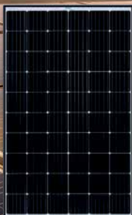
PERC 310 W Hyötysuhde 18,6 %