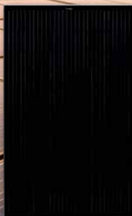
PERC 320 W Hyötysuhde 18,3 %