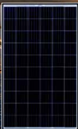
PERC 285 W Hyötysuhde 17,1 %